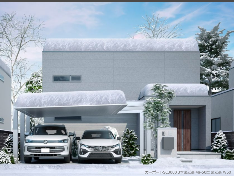
カーポートSC3000 3本梁延長 48-50型 梁延長 W60