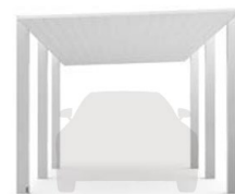
NEW カーポートSC 3000

1台用 基準風速 V0=46m/s 耐積雪強度 100cm相当 (3000N/m 2 )