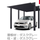
屋根材：ダスクグレー 柱・梁：ダスクグレー