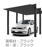
屋根材：ブラック 柱・梁：ブラック