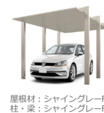
屋根材：シャイングレー 柱・梁：シャイングレー