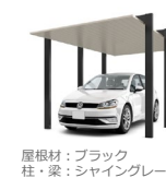
屋根材：ブラック 柱・梁：シャイングレー