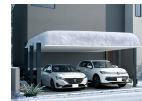
3000 2台用 NEW

※記載の商品写真は印刷のため実際の色とは多少の差があります。現物またはサンプルなどにてご確認ください。 ※表示価格は、商品代だけのメーカー希望小売価格で、消費税、取付費・工事費など別途ご負担をお願いいたします。 ※掲載内容及び写真・図版の無断転載はかたくお断りします。(許可なく転載・流用した場合、損害賠償が発生します。) ※仕様・価格は予告なく変更する場合がありますので、ご了承ください。