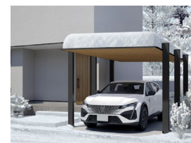
3000 1台用 NEW