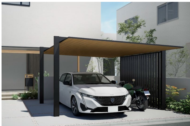
目隠しにもなる、格子のアクセント カーポートSC 1500 1台用：42-50型

ノイズレスでスマートなデザインはそのままに、耐積雪強度が高いカーポートを実現。 日々の生活をより安心・安全にします。