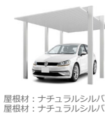
屋根材：ナチュラルシルバー 屋根材：ナチュラルシルバー